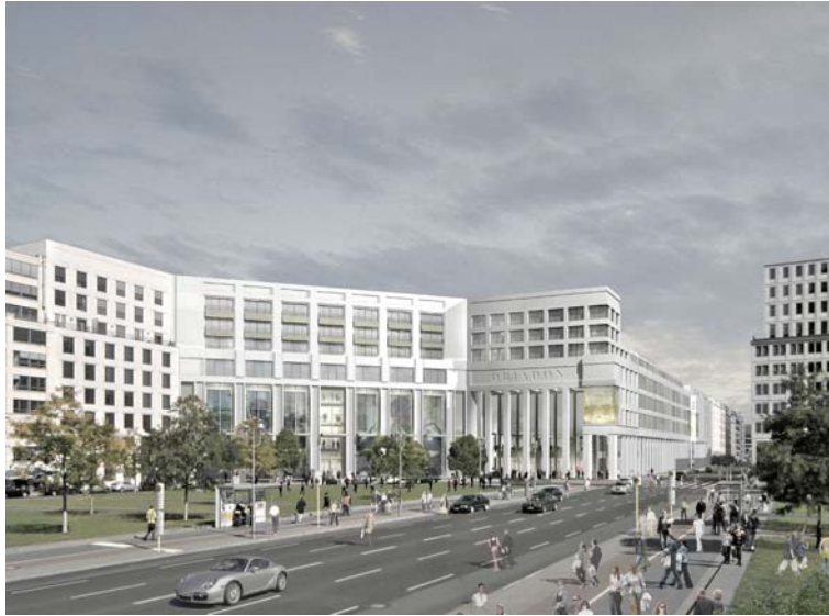
Perspektive Leipziger Platz