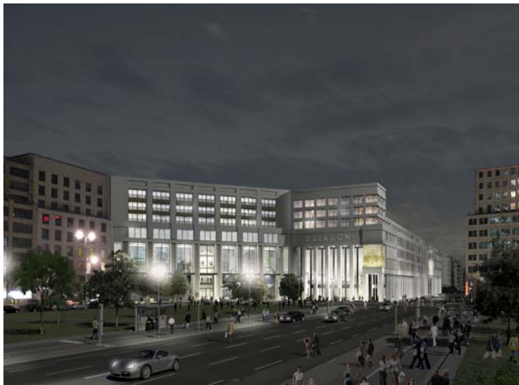
Perspektive Leipziger Platz, Nacht